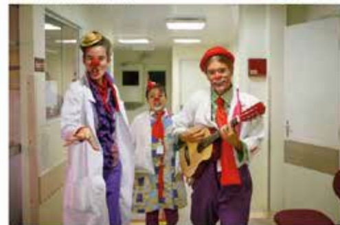
Palhaços estão em Paranavá nos dias 23, 24, e 25 de setembro

Paranavá vai receber neste final de semana (23, 24, e 25) os palhaços (as) da "Trupe da Saúde". O grupo curitibano estará ao lado dos voluntários do Médicos do Humor para visitar a Santa Casa do Paranavá e compartilhar experiências de atuação. Com nariz vermelho, roupas coloridas e um grande sorriso, os artistas se preparam para proporcionar alegria aos pacientes.